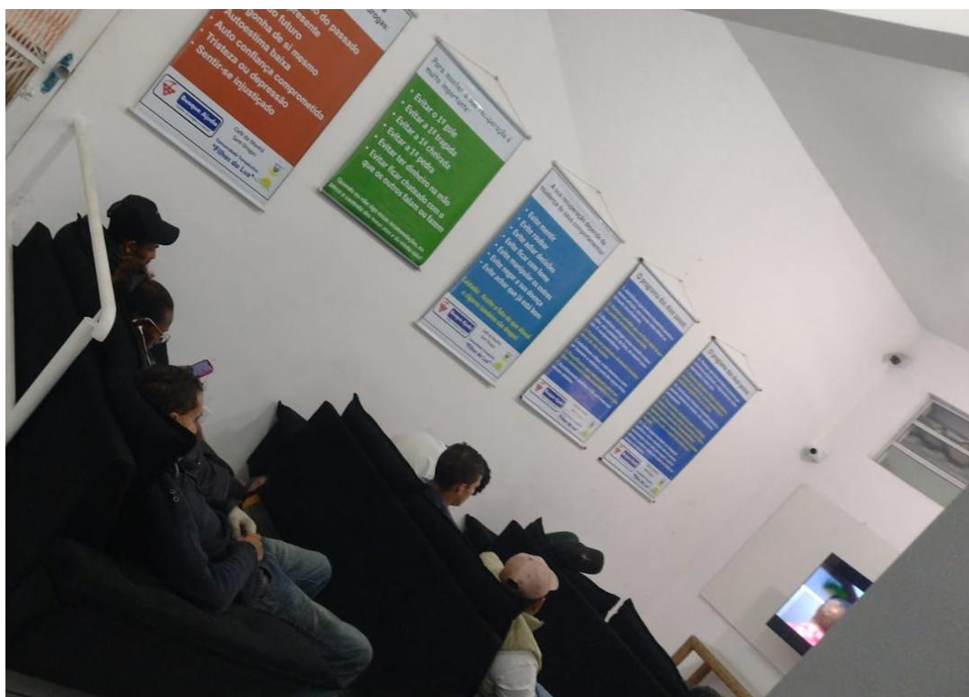
Figura 4: Sala de Televisão – 16/06/2025