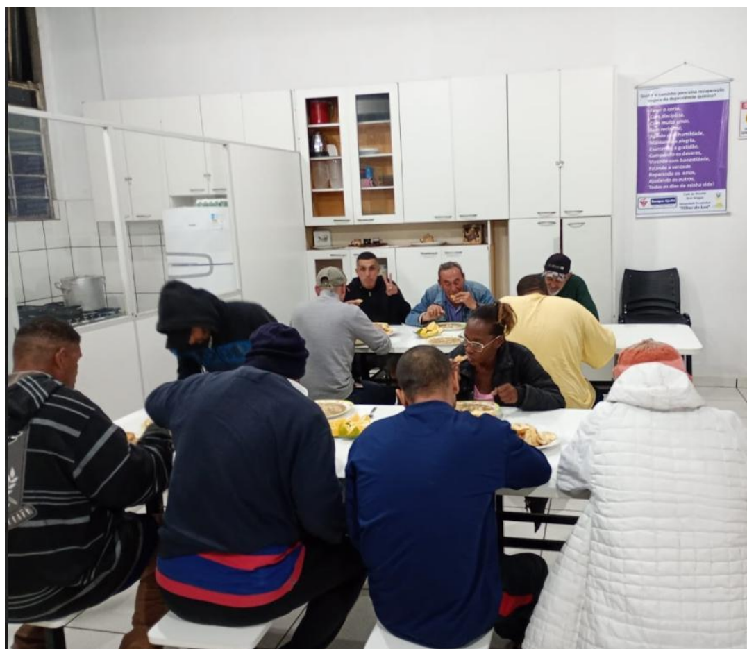
Figura 2: Lanche da Noite, 13/06/2025