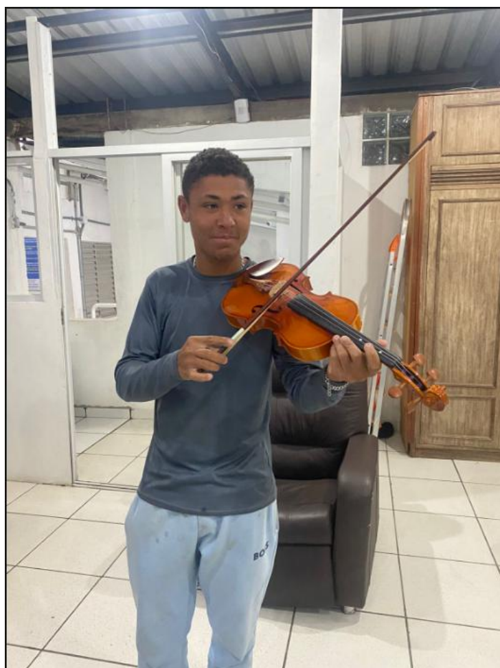
Figura 6: Aprendendo com os voluntários da Congregação – 27/06/2025