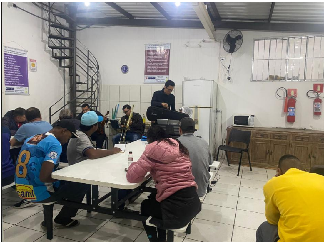
Figura 5: Congregação no Albergue – 27/06/2025