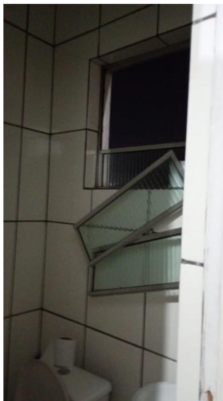
Figura 3: Janela quebrada, 13/06/2025