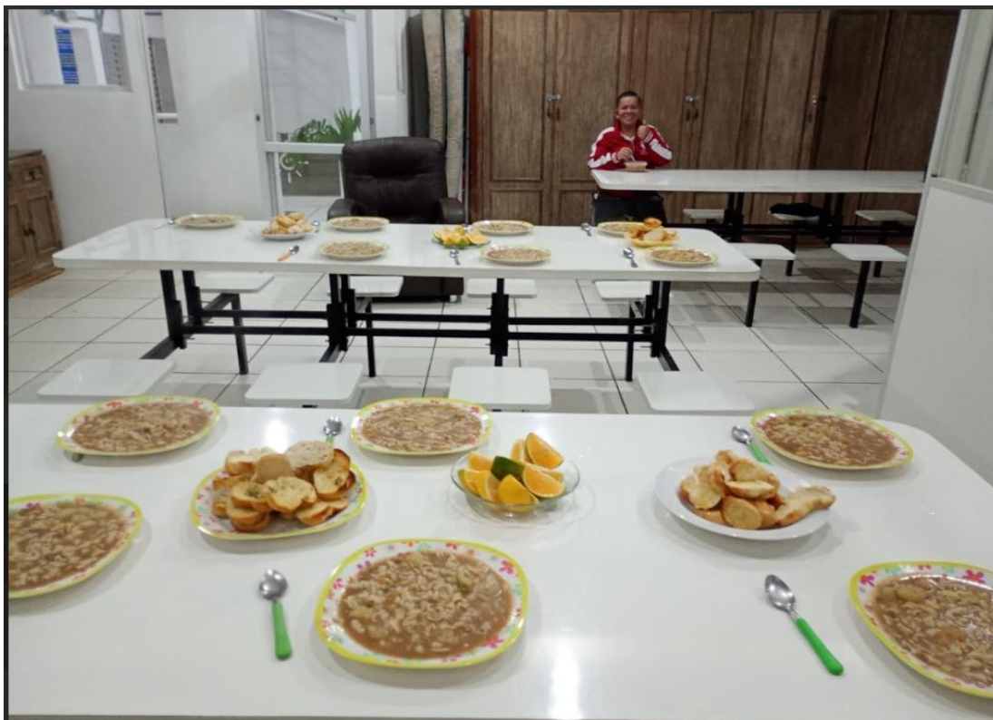
Figura 1: Lanche da noite – 13/06/2025