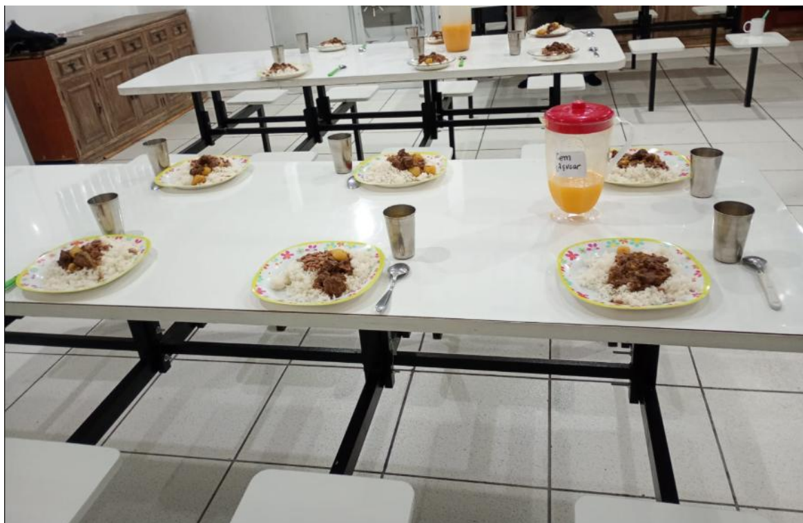
Figura 7: Lanche da Noite, 29/06/2025